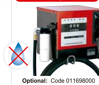
Optional: Code 011698000