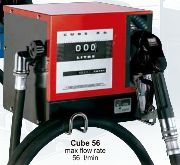
Cube 56 max flow rate 56 l/min