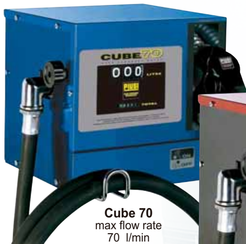
Cube 70 max flow rate 70 l/min